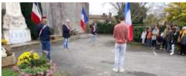
Le Maire et son Conseil Municipal