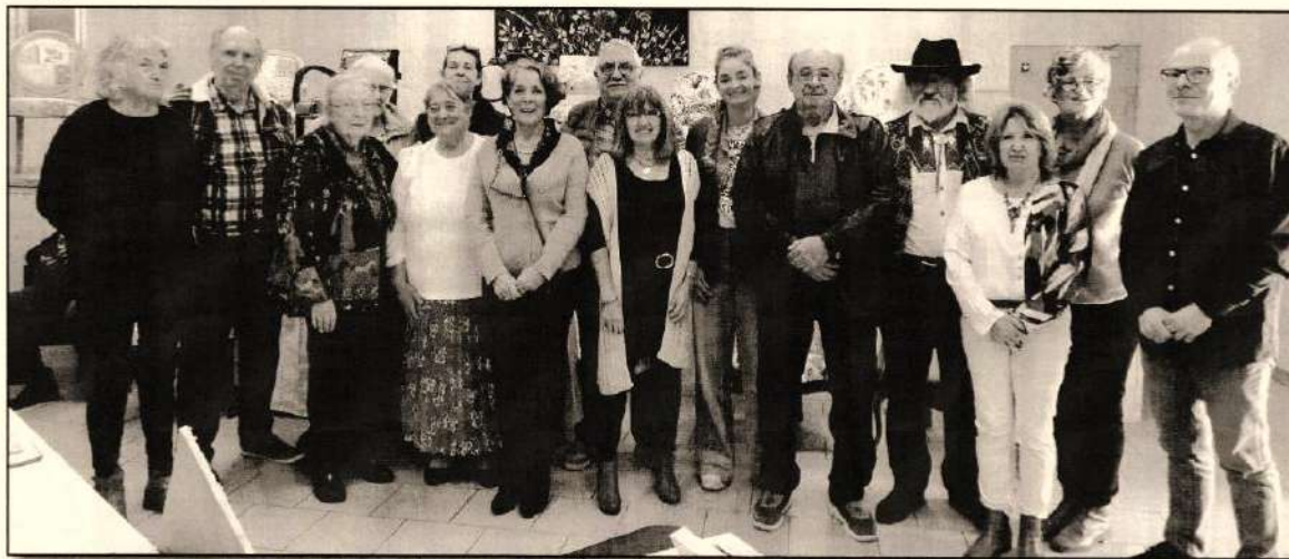
Le Maire et son Conseil Municipal